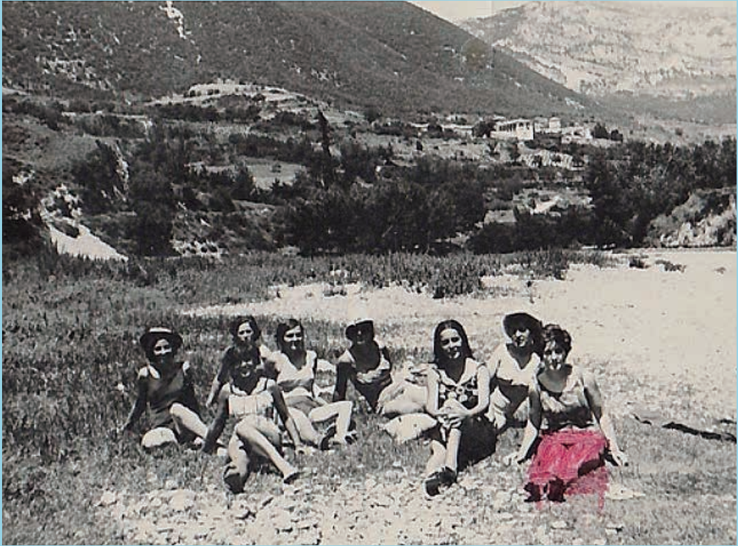
[Bidaurretako neskek bikinia jantzita, udan] (Zer pentsatuko ote luke “gelariak”?)

Auzolana ere badugu, gizartearen onurarako eta baterako lanean oinarritutako gizarte-erabileretako bat. Parte hartzeko eremu hori batez ere maskulinoa bazen ere, egiten ziren zereginengatik (bideak garbitzea...), baziren antzeko espiritua zuten beste zeregin batzuk, emakumeek egiten zituztenak, nahiz eta teoriarik auzolanetik kanpo egon. Hori zen herriko jaien eta ospakizun garrantzitsuen kasua (Aste Santua, adibidez); haietan, emakumeak aldareak prestatzeko mobilizatzen ziren. Gainera, garai haietan, kaleen garbiketa etxe bakoitzari zegokion kale-zatia mantentzeko ohiko lanak baino sakonagoa izaten zen.