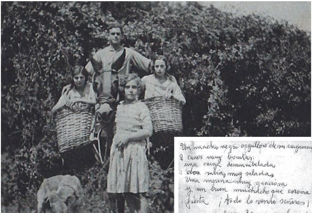
[Goikoetxea Cilveti ahizpen eta nebaren argazkia, 1934koa. Eskuz idatzitako oharra argazkiaren atzealdean ageri da]

Un macho negro orgulloso de su cargamento 2 canes muy bonitas, una carga desaminibelada 2 cosas milia muy saladas Una moena muy graciosa y un buen muchacho que corona la fiesta ; todo lo vendo señores ! por 30,000 reales ; Quien lo compra ? ; Quien ? a la una a las dos y a las tres ; Quien lo compra señores !