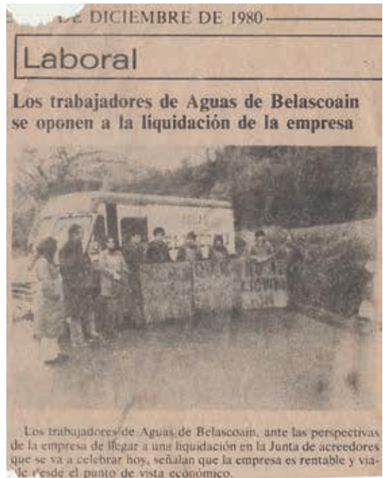
[Belascoain enpresaren itxiera 1980]

Aparteko aipamena egin behar zaio Iruñean egiten zen salmentari: barazkiak, fruta (gereziak, intxaurrak...), etxeko hegaztiak, arrautzak eta abar . Emakumeak autobusez joaten ziren hara, eta, haien salgaiak hiriburuko merkatuetan jartzeaz gain –besteak beste, San Domingoko merkatuan–, haiek erosten zituzten saltokien sare handi bat ere bazuten (Mañueta kalean, Kale Nagusian San Saturninotik hurbil...), hala nola Torrens ospetsua.