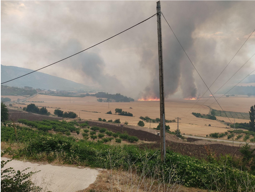
Vista de pavesas en Etxarri del incendio de Legarda en 2022

La presente propuesta se redacta a petición de diversos municipios del Valle de Etxauri y tiene como objetivo la localización de zonas críticas en la propagación de incendios , es decir, áreas fuera capacidad de extinción, la determinación de puntos estratégicos de gestión para reducir la posibilidad de propagación y el establecimiento de unas directrices generales de gestión ago-silvo-pastorales de dichos puntos estratégicos. en los municipios que componen el Valle de Etxauri: Etxauri, Ciriza, Etxarri, Bidaurreta, Belaskoain y Zabalza.